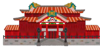
琉球王国のグスク及び関連遺跡群