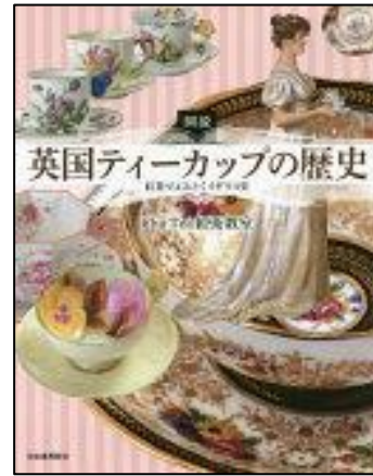
『図説 英国ティーカップの歴史』 Cha Tea紅茶教室 著 河出書房新社

ビスケットとクッキーについて、古代ローマをはじめとする各地域の歴史から紐解きます。