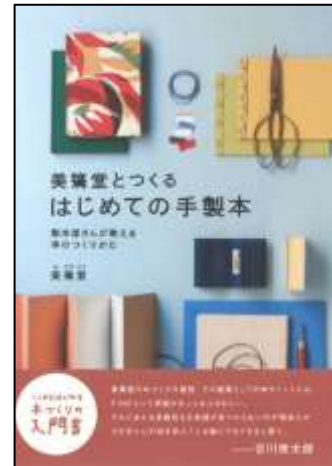
『美篤堂とつくるはじめての手製本』 美篤堂 著 河出書房新社

著者が手に入れた、奈良時代から明治時代にかけての写本や手紙、木版画などの貴重資料を紹介します。