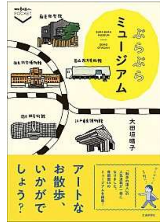
『ぶらぶらミュージアム』 大田垣 晴子 著 交通新聞社

パリにある数々の美術館の魅力を、荘厳な写真とともに紹介しています。複数の筆者による個別のコメントも見どころのひとつです。