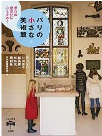
『パリの小さな美術館』 原田 マハ 他 著 新潮社

パリにある数々の美術館の魅力を、荘厳な写真とともに紹介しています。複数の筆者による個別のコメントも見どころのひとつです。