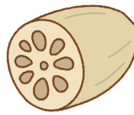
れ ん こん