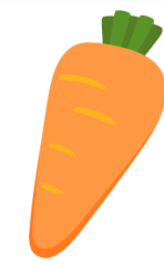
に ん じん