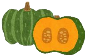
かぼちゃ ( なん き ん )

12月22日は冬至です。1年の終わりが近いので、五十音の終わりの文字「ん」のつくものを食べるとよいとされているよ。たくさん食べて体調を整えよう！