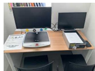
左：拡大読書器 右：よむべえ