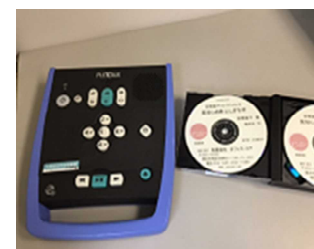
左：再生機 右：デジター図書